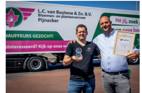
L.C. van Buytene & Zn: trots op het Lean & Green-certificaat